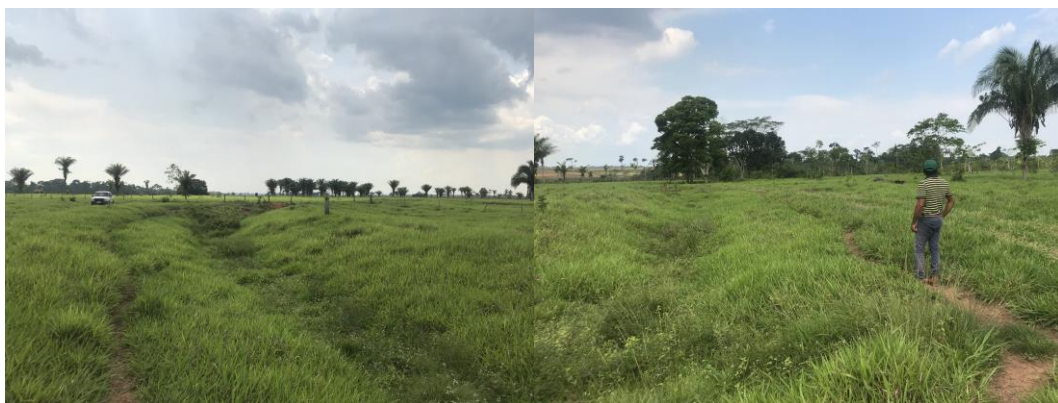
Figura 4. Sítio Fazenda Crichá.