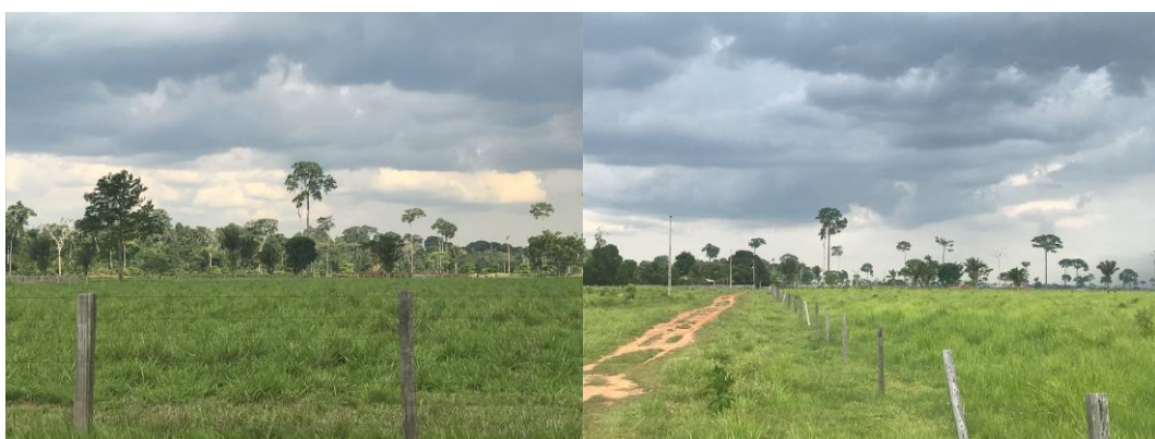
Figura 6. Sítio Fazenda Crichá.

Sobre o sítio Corassal, não foi possível entrar na fazenda pois o proprietário não estava ali. Contudo, verificou-se a presença de atividades recentes de revolvimento de solo no sítio.