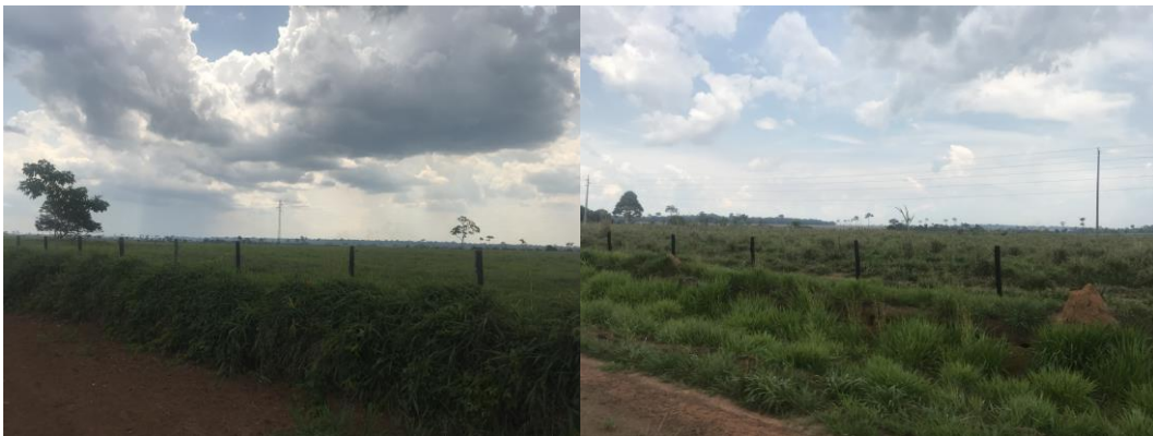
Figura 2. Acesso ao sítio Fazenda Crichá.