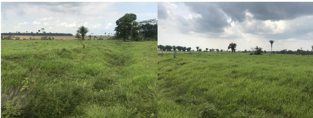
Figura 3. Sítio Fazenda Crichá.