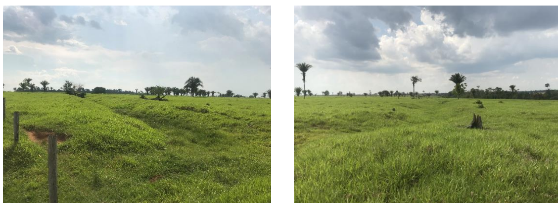
Figura 5. Sítio Fazenda Crichá.

Sobre o sítio Corassal, não foi possível entrar na fazenda pois o proprietário não estava ali. Contudo, verificou-se a presença de atividades recentes de revolvimento de solo no sítio.